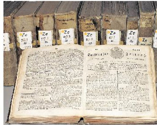
Die empfindlichen Originale der „Karlsruher Zeitung“ sind in dicke Bücher gebunden – jetzt kann man vom heimischen Computer aus alle erhaltenen Ausgaben dieses Blattes von 1784 bis 1933 einsehen.

erschienen. Eine Garantie dafür, innerhalb dieses Zeitraums jede gewünschte Ausgabe zu finden, gibt es allerdings nicht: Wegen Zerstörungen im Zweiten Weltkrieg weist die Überlieferung der Badischen Landesbibliothek Lücken auf. Diese konnten bei der Digitalisierung weitgehend, aber eben nicht 100-prozentig durch Bestände des Karlsruher Stadtarchivs geschlossen werden. Über eine Kalendertabelle kann man auf einzelne Zeitungsausgaben zugreifen – doch der Service soll noch viel besser werden, verspricht Ludger Syré: Ein Volltexterkennungsprogramm, das in der